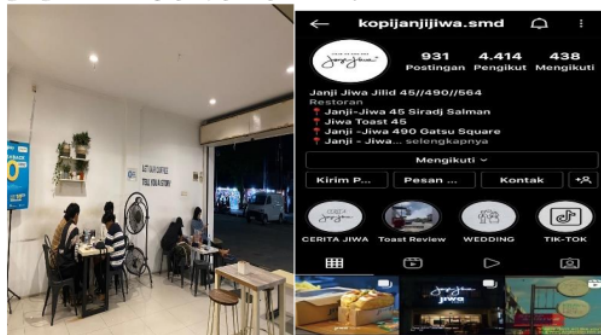
Gambar 5. Suasana Outlet dan Akun Instagram Janji Jiwa Samarinda

Dari informasi yang dijelaskan oleh Bapak Irfan Fadhilah selaku manajer Janji Jiwa Jilid 490, menyampaikan bahwa strategi tempat yang digunakan untuk usaha sudah bagus karena dekat dengan area perkantoran dan juga strategis dalam pemilihan tempat. Selain itu tempat yang digunakan terbilang cukup nyaman karena terdapat free wifi , tempat duduk untuk nongkrong, serta lingkungan yang bersih. Berikut outlet dan akun Instagram sebagai tempat komunikasi pemasaran yang digunakan Kopi Janji Jiwa Jilid 490 yaitu: