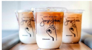
Gambar 1. Produk Kopi Janji Jiwa

Salah satu gerai yang memelopori tren kopi susu di Samarinda, ialah gerai Kopi Janji Jiwa. Yang pertama kali didirikan pada tahun 2018 di ITC Kuningan, Jakarta. Sejak awalnya berdiri gerai Kopi Janji Jiwa, sudah tercatat ada lebih dari 700 gerai yang tersebar di seluruh Indonesia. Salah satunya Di Kota Samarinda, Kopi Janji Jiwa pertama kali berdiri pada bulan November 2018, di Makan-Makan Jalan Pangeran Antasari. Hingga tahun 2023, telah tercatat ada 11 gerai Kopi Janji Jiwa yang berdiri di Kota Samarinda. Tetapi pada penelitian ini, peneliti akan berfokus pada gerai pertama Kopi Janji Jiwa di Samarinda, Kopi Janji Jiwa Jilid 490 yang terletak di Jalan Gatot Subroto karena pada gerai ini merupakan gerai yang ramai dengan pengunjung daripada gerai lainnya.