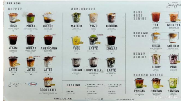
Gambar 2 Daftar Menu coffee di Janji Jiwa