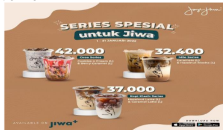
Gambar 4. Contoh Promosi yang Dilakukan Kopi Janji Jiwa